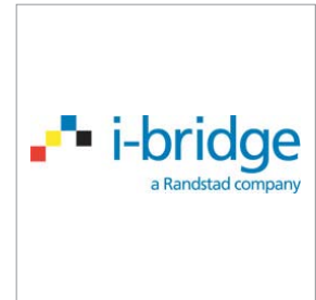
☑ Logo I-bridge.